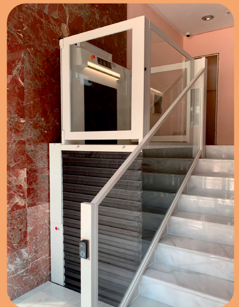
FUELLE PERIMETRAL DE PROTECCIÓN