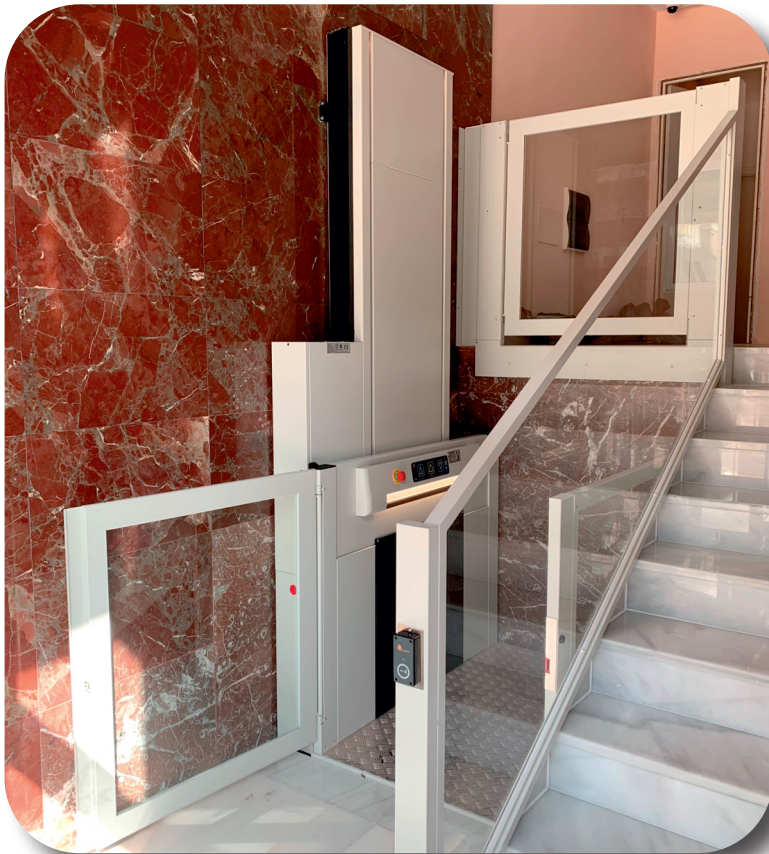
Pulsadores de abordo sensitivos y NFC en piso